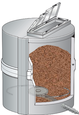
Mall-Hackschnitzelspeicher z.B. ThermoPal 60000